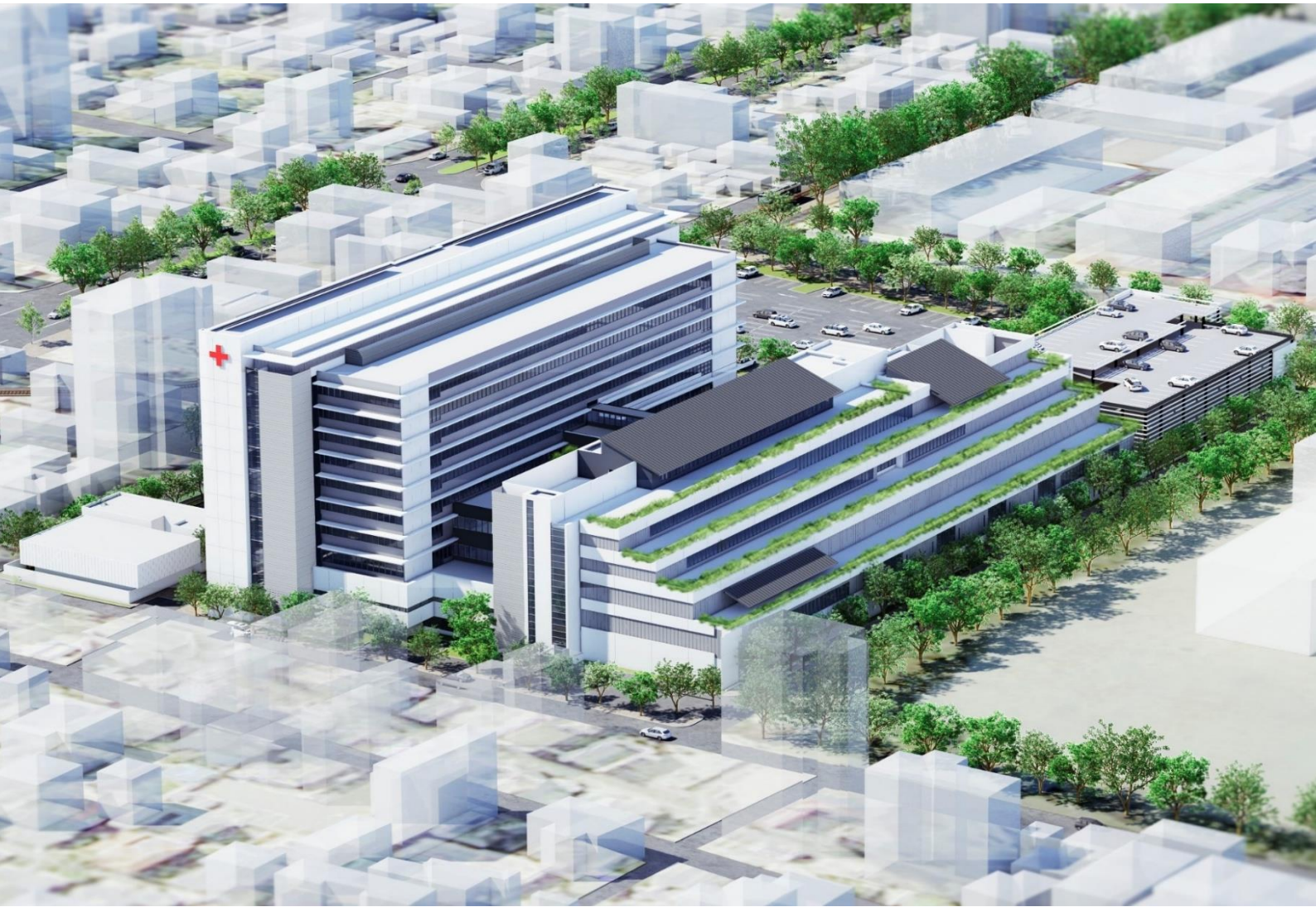
松山赤十字病院 北棟（第1期工事）終了 南棟は第2期工事 平成33年竣工予定